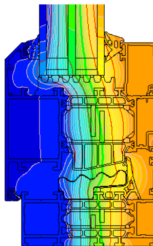
ukažkové rozloženie izoterm pre kombináciu rámu a dverného krídla systému GN OUTi+ (GN521 + GN010)